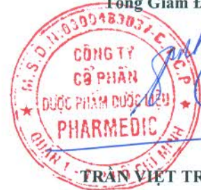
TRẦN VIỆT TRUNG