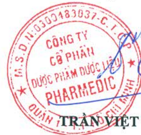
TRẦN VIỆT TRUNG