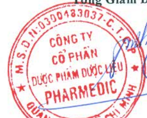
TRẦN VIỆT TRUNG