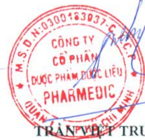
TRẦN VIỆT TRUNG