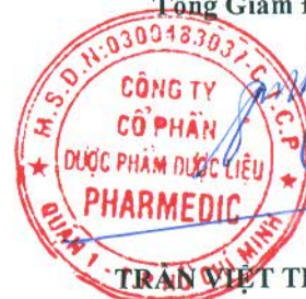
TRẦN VIỆT TRUNG