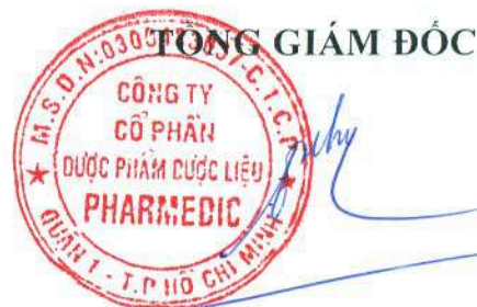
Trần Việt Trung